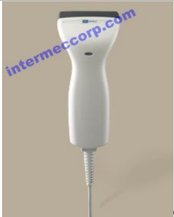
CipherLAB 1090+ CCD 大视场有线接触式

CipherLAB 1090+ 扫描快速、轻松、精确，可扫描最宽达 90 毫米的条码。这款大视场扫描仪可更灵活地扫描标签。通过加速处理流程和减少扫描错误，它可提高结账通道、商店卖场和文印中心的工作效率。1090+ 采用激光，操作舒适安全，可全天使用。