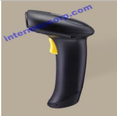
CipherLAB 1562 无线激光扫描器

CipherLab 1562无线激光扫描器灵活、可靠,可有效帮助员工完成更多工作中获益良多,无论是办公地点还是在仓库现场,只需轻点按键即可精确刀架的直视距离范围最远可达 90 米。即使在此范围以外,也能切换成关注细节运营、保持顶尖地位的最佳选择。